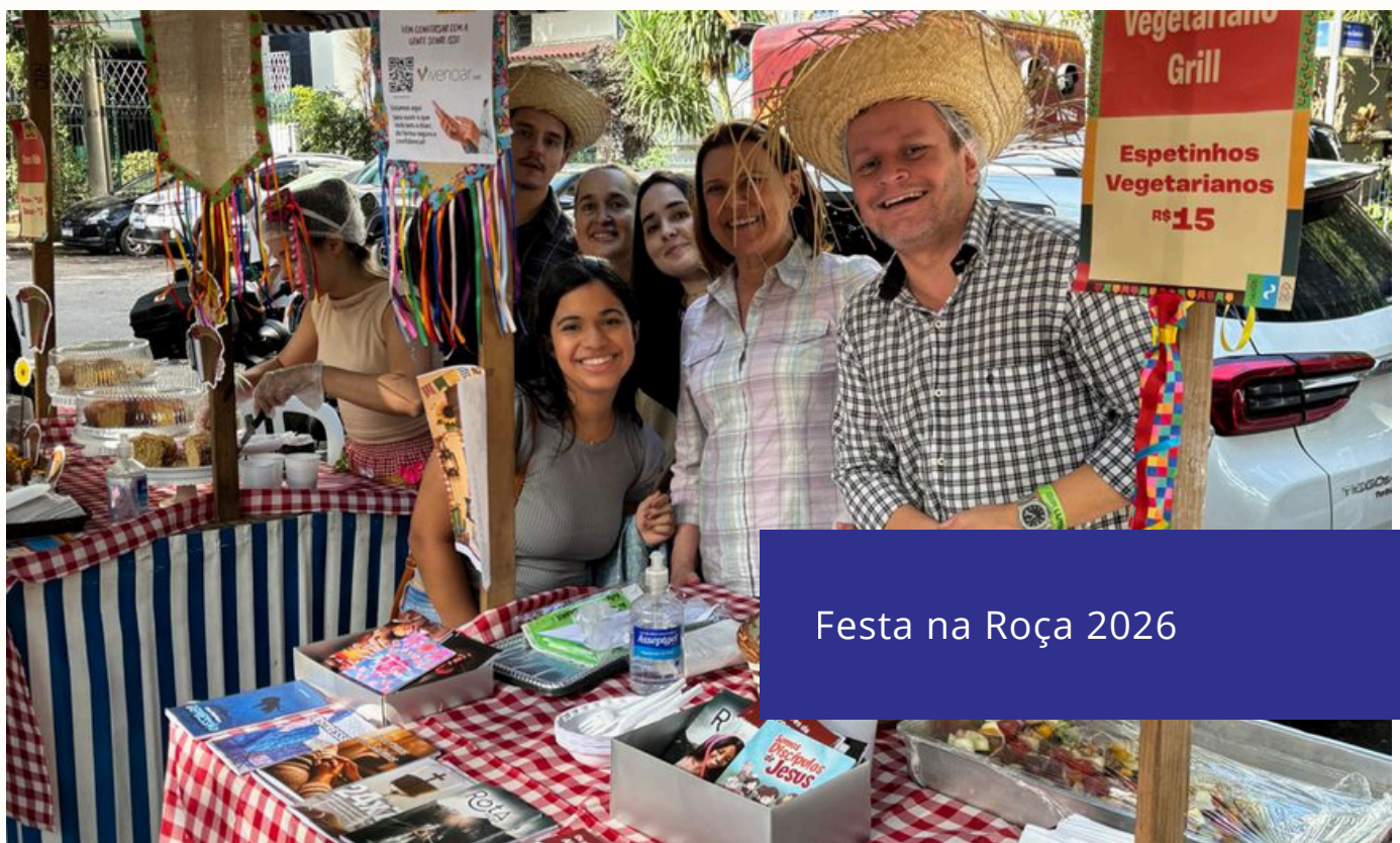
Festa na Roça 2026